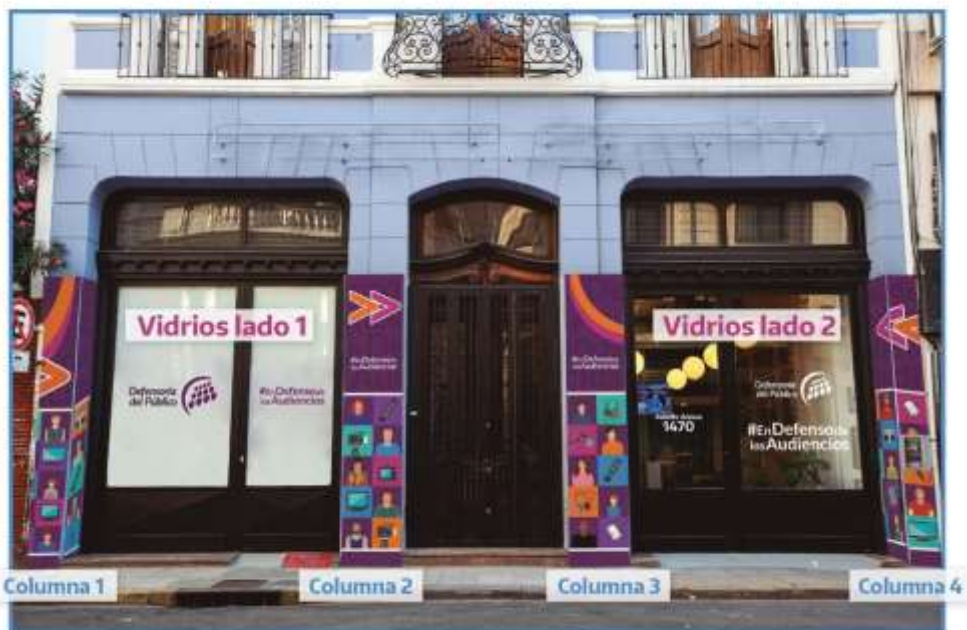
Plotteo frente Referencias

Renglón N° 1 : Ploteo de fachada de acuerdo a imagen.