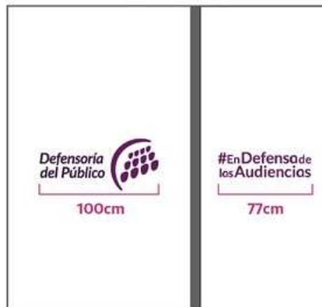
Vidrios lado 1

Vidrio lado 1: Vinilo de corte blanco impreso a dos colores. Incluye colocación. Medidas de acuerdo a la imagen.